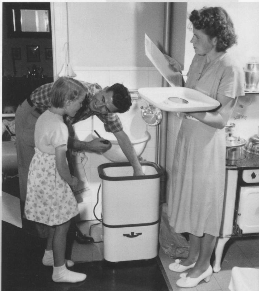
Far viser stolt fram familiens første vaskemaskin.