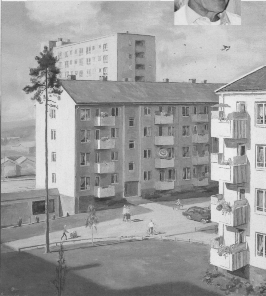
Lambertseter 1957, malt av Arne Stenseng.

Vi fikk to barn; først ei jente, Turid, og så en gutt, Jan. Borghild tok seg av barna og prøvde å organisere hverdagen best mulig. Jeg var